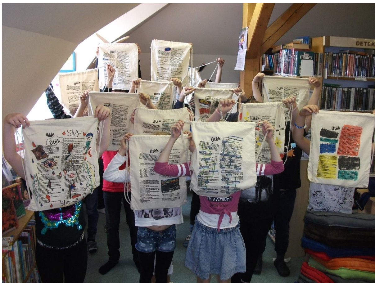
Obrázek 1 – Řepišťe – Blackout poetry