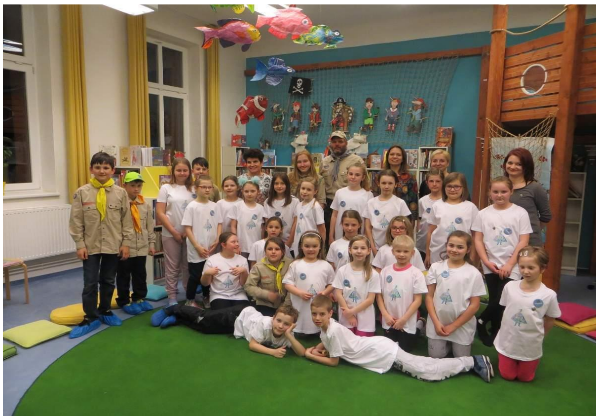
Obrázek 10 – Noc s Andersenem v knihovně v Petřvaldu (Karviná)