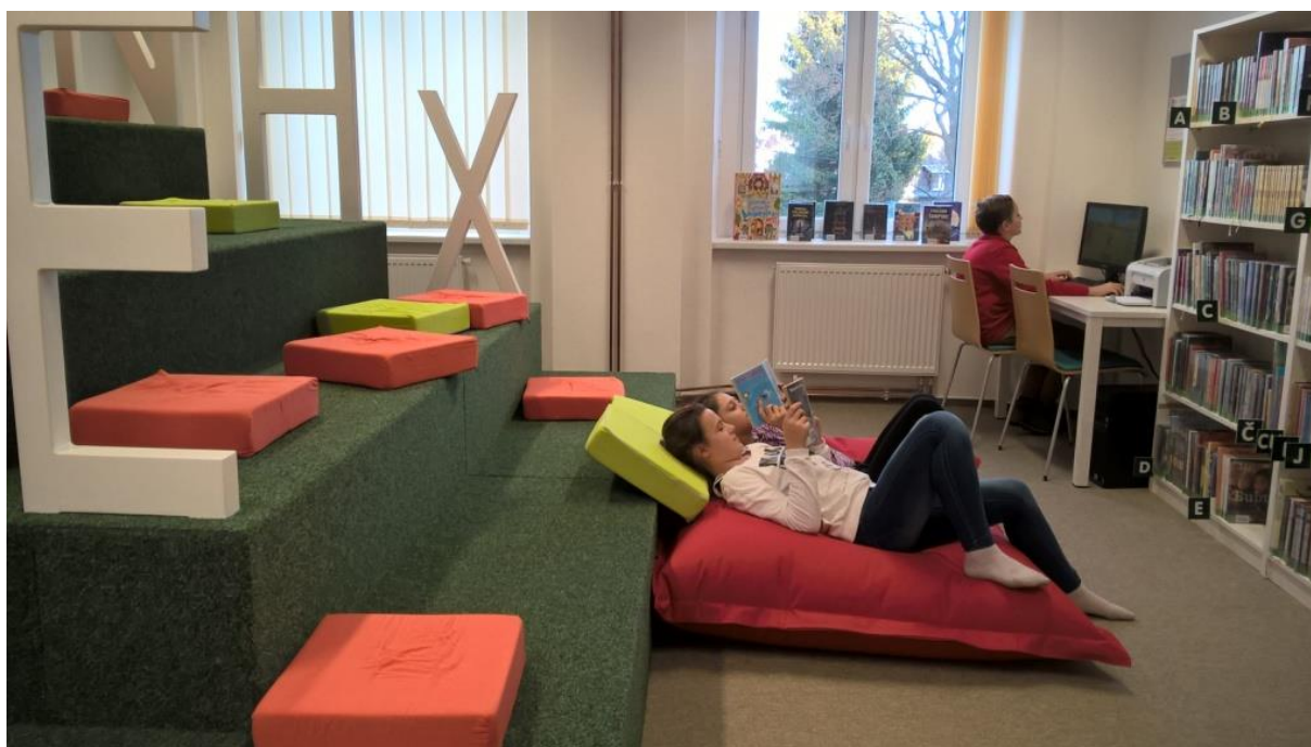
Obrázek 4 – MěK Rýmařov – nová knihovna