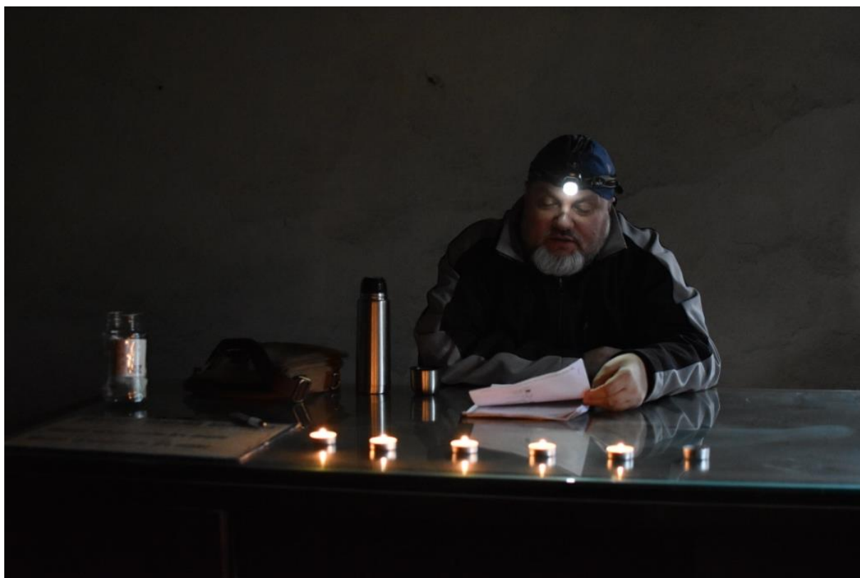
Obrázek 7 – MěK Rýmařov – Noc literatury ve starém pivovaru