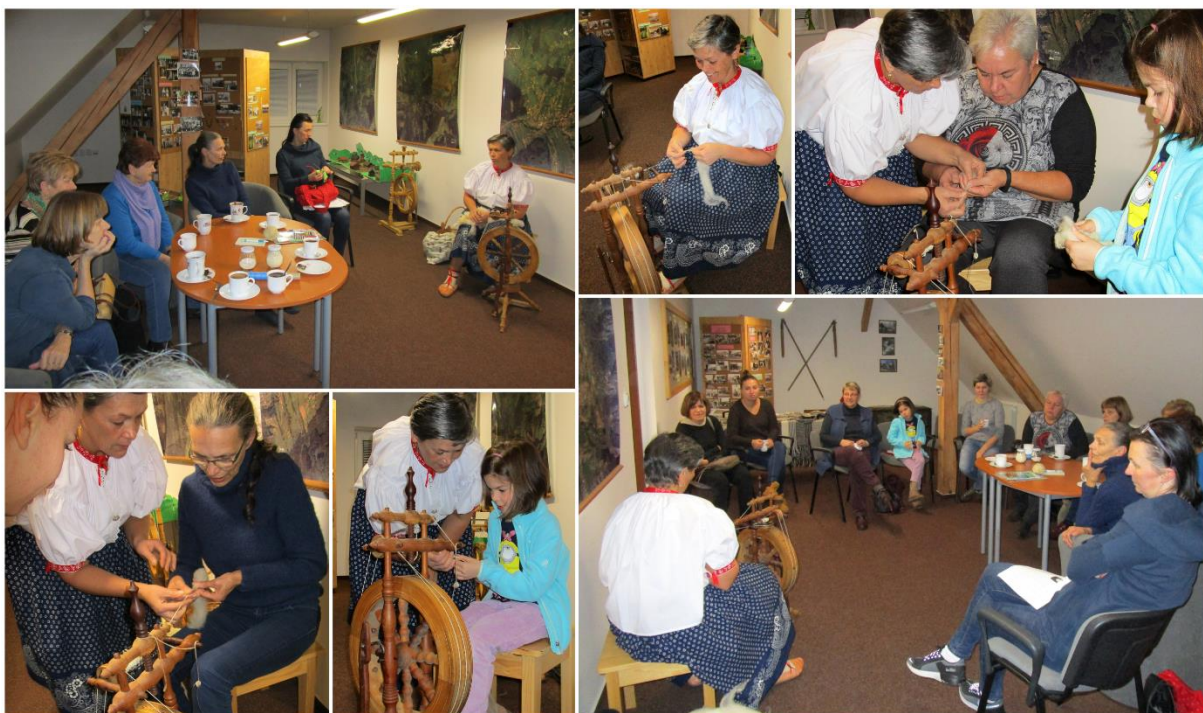
Obrázek 12 – Knihovna Nýdek – Klubičko předení