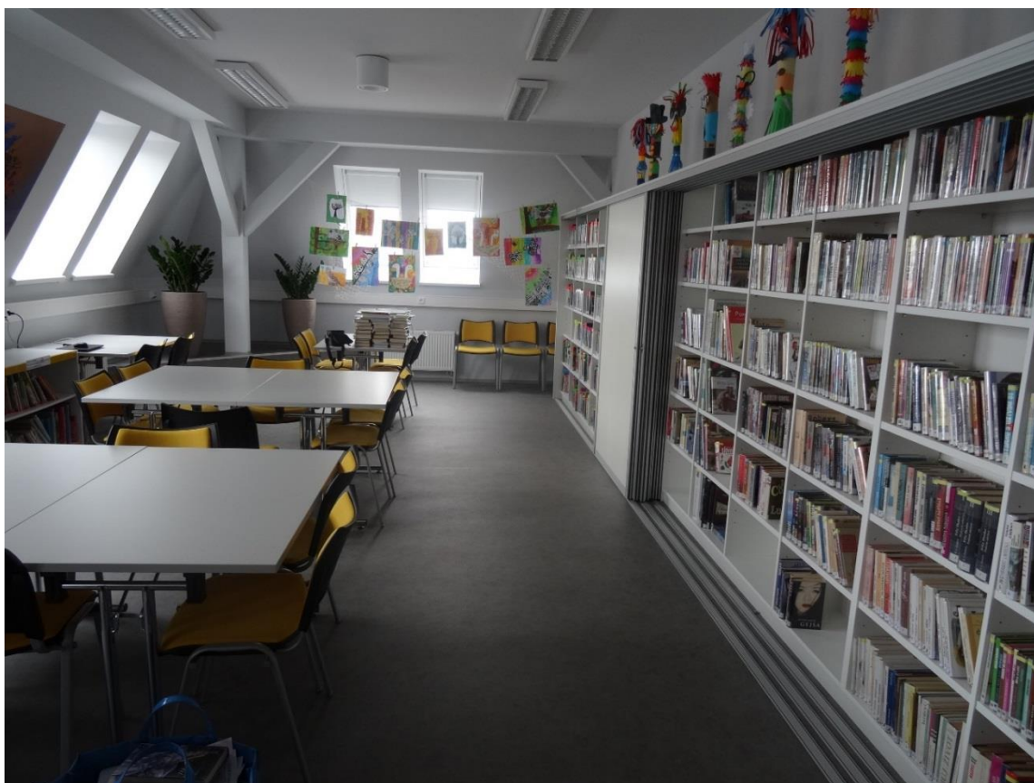
Obrázek 2 – Místní knihovna Otice, nové prostory

Knihovna města Ostravy zprovoznila v ústřední knihovně American Corner. Toto oddělení je provozováno ve spolupráci s Velvyslanectvím USA v Praze a nabízí konverzace angličtiny s rodilými mluvčími, možnosti studia v USA, besedy, výstavy a workshopy. American Corner bylo zřízeno v prostorách hudebního oddělení knihovny, které tak bylo přestěhováno do půjčovny pro dospělé. Od září rozšířila KMO své pobočky na počet 28. Nově vzniklá pobočka Bartovice v ÚMOB Radvanice a Bartovice nabízí své služby v prostorách Společenského domu, součástí pobočky je také klub Bartík pro maminky s dětmi.