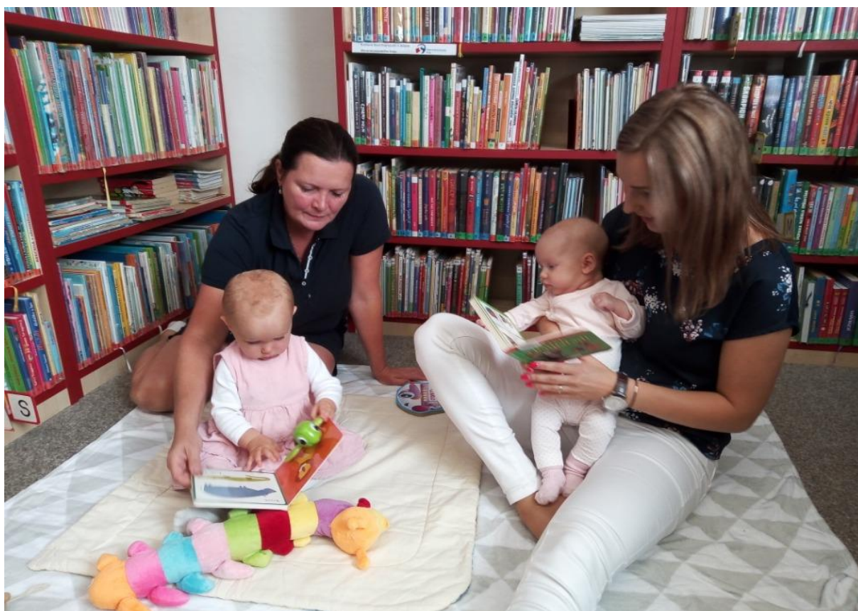
Obrázek 11 – Bookstart – S knížkou do života, ObK Těrlicko