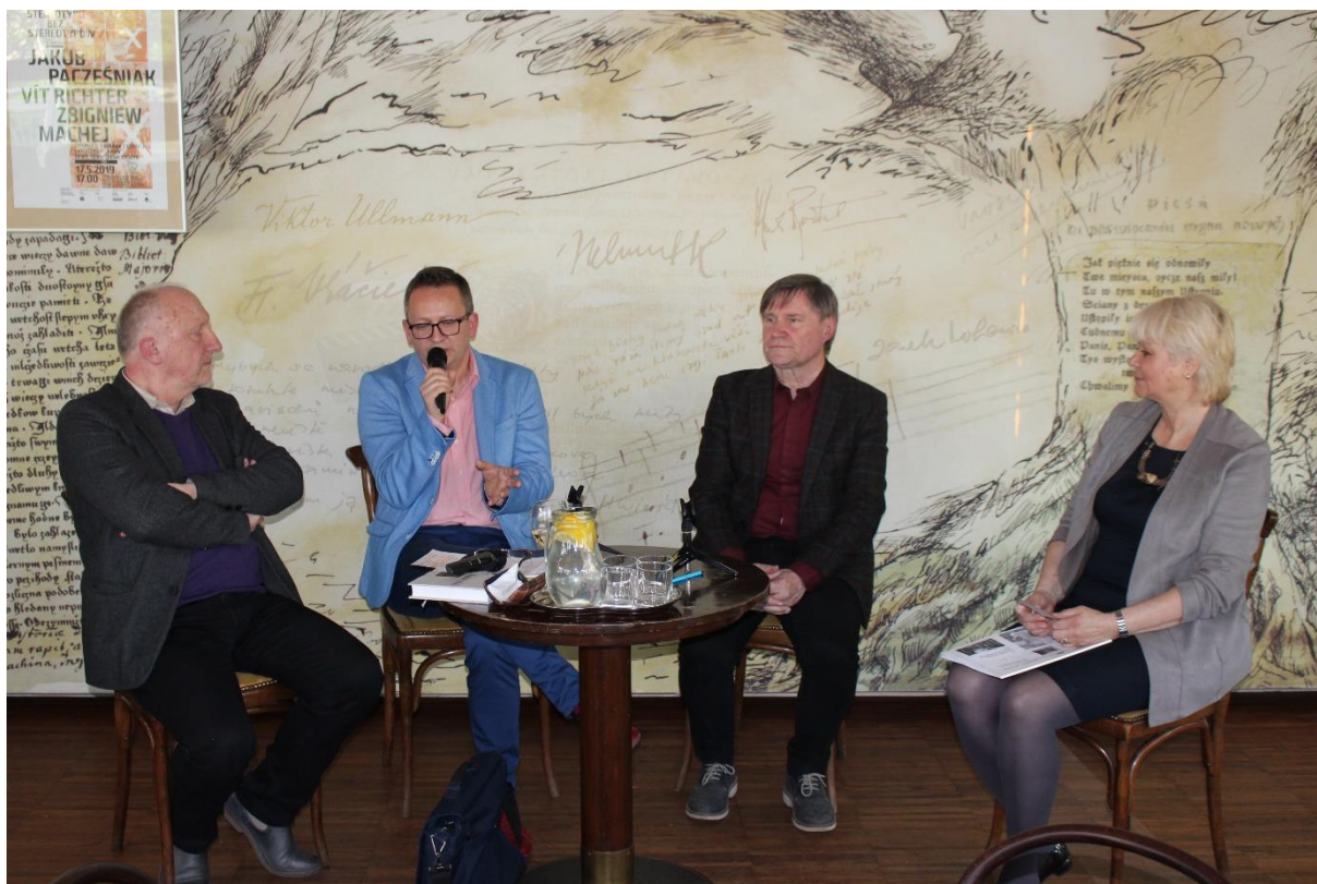
Obrázek 8 – MěK Český Těšín – Diskuzní pořad Bez stereotypů k 100. výročí knihovního zákona