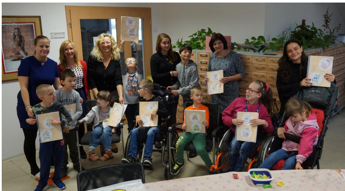
Obrázek 9 – Regionální knihovna Karviná – Projekt Společně s úsměvem