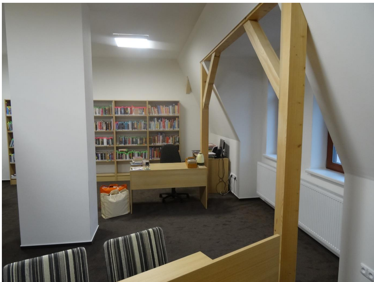
Obrázek 3 – MK Oldřišov v novém