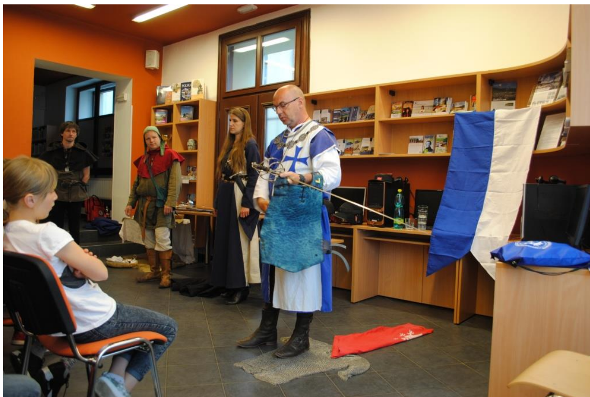
Obrázek 6 – MK Horní Benešov – beseda Společenství Severských pánů