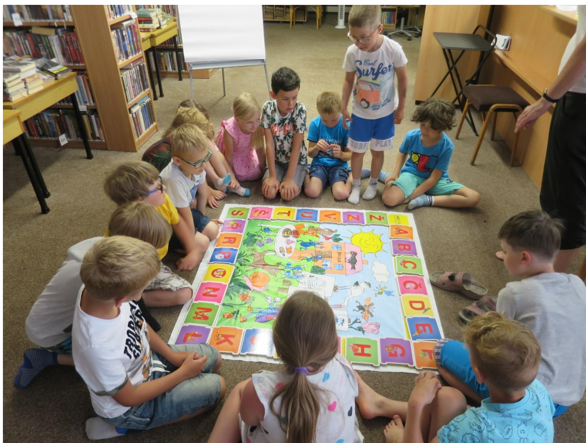
Obrázek 13 – MěK Vratimov – Mudrování s písmenky