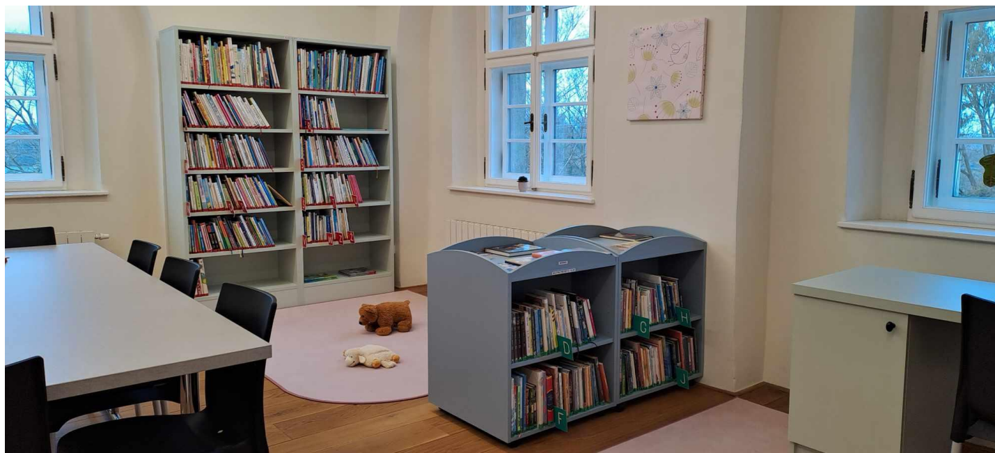
ObK Stará Ves nad Ondřejnicí