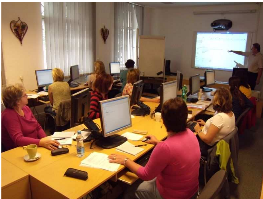
Foto č. 5: Kurz „Šablona webu“ v regionálním školicím středisku MSVK

Pro rok 2012 byl zpracován projekt v rámci podprogramu VISK 2 – Vzdělávání pracovníků knihoven (Expertní kurzy – zvyšování kompetencí v oblasti elektronických služeb knihoven).