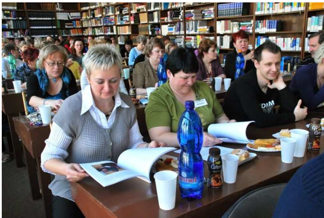
Foto č. 2: Slavnostní shromáždění zaměstnanců MSVK k šedesátinám knihovny

Rozvoj služeb knihovny i změny v dalších aktivitách v uplynulém desetiletí byly zachyceny v mimořádné zprávě s názvem „Od padesátky k šedesátce“, kterou MSVK k výročí připravila. Zcela ojedinělou událostí pak bylo květnové vydání dvousvazkové publikace retrospektivní bibliografie okresu Ostrava-město, která vycházela z rozsáhlé bibliografické databáze s cca 15 000 záznamy. Tištěné vydání bylo umožněno díky účelové dotaci zřizovatele. Publikace byla slavnostně pokřtěna 17. 6. na Letním knižním veletrhu v Ostravě, kde také proběhla poslední akce konaná v souvislosti s výročím, a to seminář pro knihovnice, knihovníky a veřejnost „S knihou nejsi nikdy sám“.