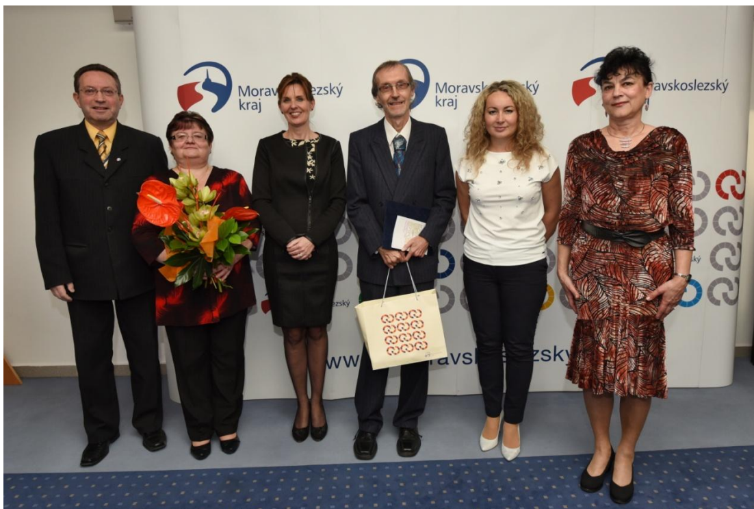
Předávání ceny vítězi Knihovnické K2 – Městské knihovně Krnov

V roce 2015 byla poprvé vyhlášena Knihovna Moravskoslezského kraje v soutěži K2.