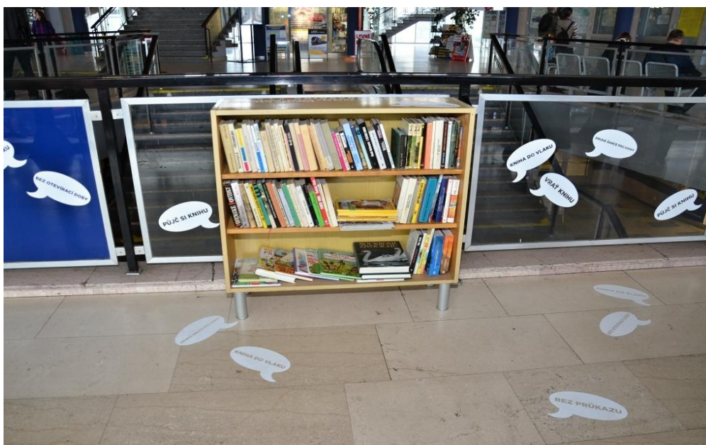
Literární čtení s Evou Kotarbovou a jejími hosty