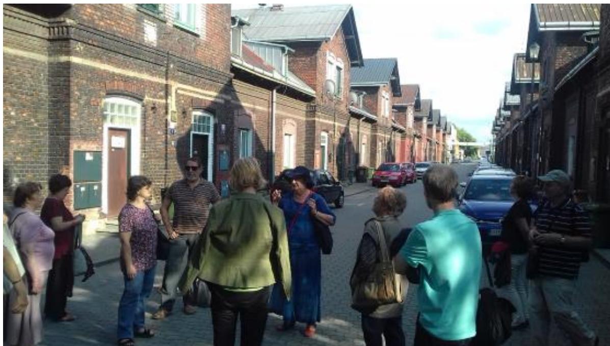
Klub regionální historie na komentované prohlídce Vítkovic