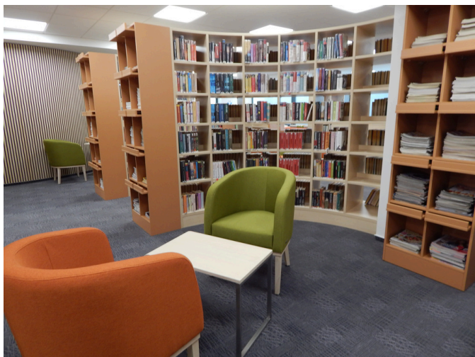
Zrekonstruované prostory MěK Vratimov