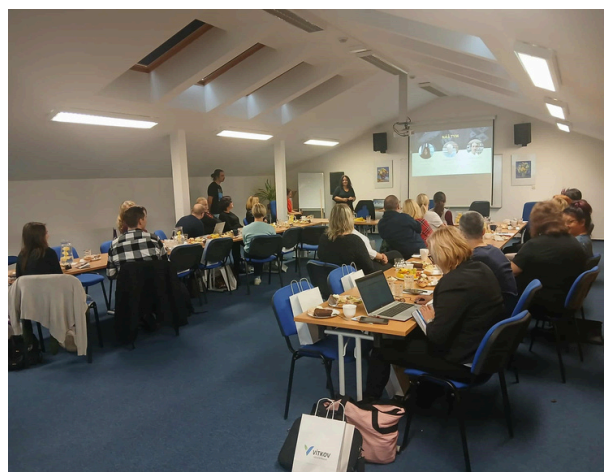
Regionální metodici na poradě v MěK Vítkov

Celkově však knihovny pro své pracovníky uspořádaly 469 vzdělávacích akcí, účast na nich dosáhla 3 713 osob.